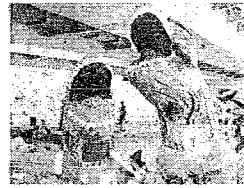
寄稿者 ばわふるみゆきさん

「ティラノサウルスレース」に出たくて着ぐるみを購入。大会が近場に無かったので、以前所属していたランニングチームにお願いして大会を開催。大人+子どものリレーとなり孫の分も購入して出場。超楽しかった🐦