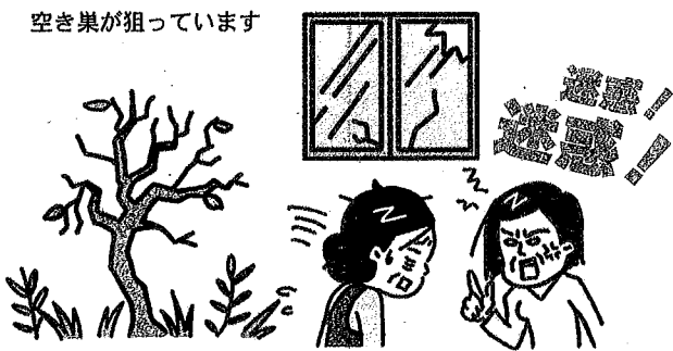
草木は伸び放題、災害などで屋根や外壁が破損して 近所からは 苦情 がきます