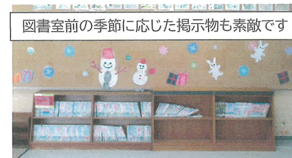
図書室前の季節に応じた掲示物も素敵です

今週は、読書ウィークでした。図書ボランティア「てんとうむし」の皆様のご協力により、学校司書が勤務していない月曜日と木曜日の業間や昼休みにも図書室を開館していただいています。これにより、図書の貸し出し数が大幅に増え、年間100冊に到達する児童が増え続けています。これからも地域の皆様のお力をお借りしながら、子どもたちが本に関心を持ち、親しめる取り組みを推進していきます。